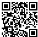
ネット出願ガイド